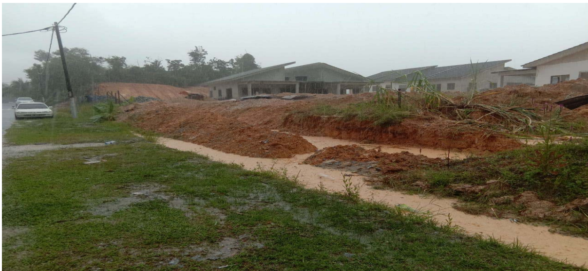
Parit Taman Lagenda Sri Aman

Taman ini mempunyai sebuah taman perumahan baru iaitu Taman Lagenda Sri Aman yang berada di hujung taman, parit utama Taman Lagenda ini menuju ke arah bawah Taman Sri Aman yang melibatkan jalan 30 dan 31 juga dilanda banjir tetapi selepas kerja membaiki pulih keadaan parit, masalah tidak timbul.