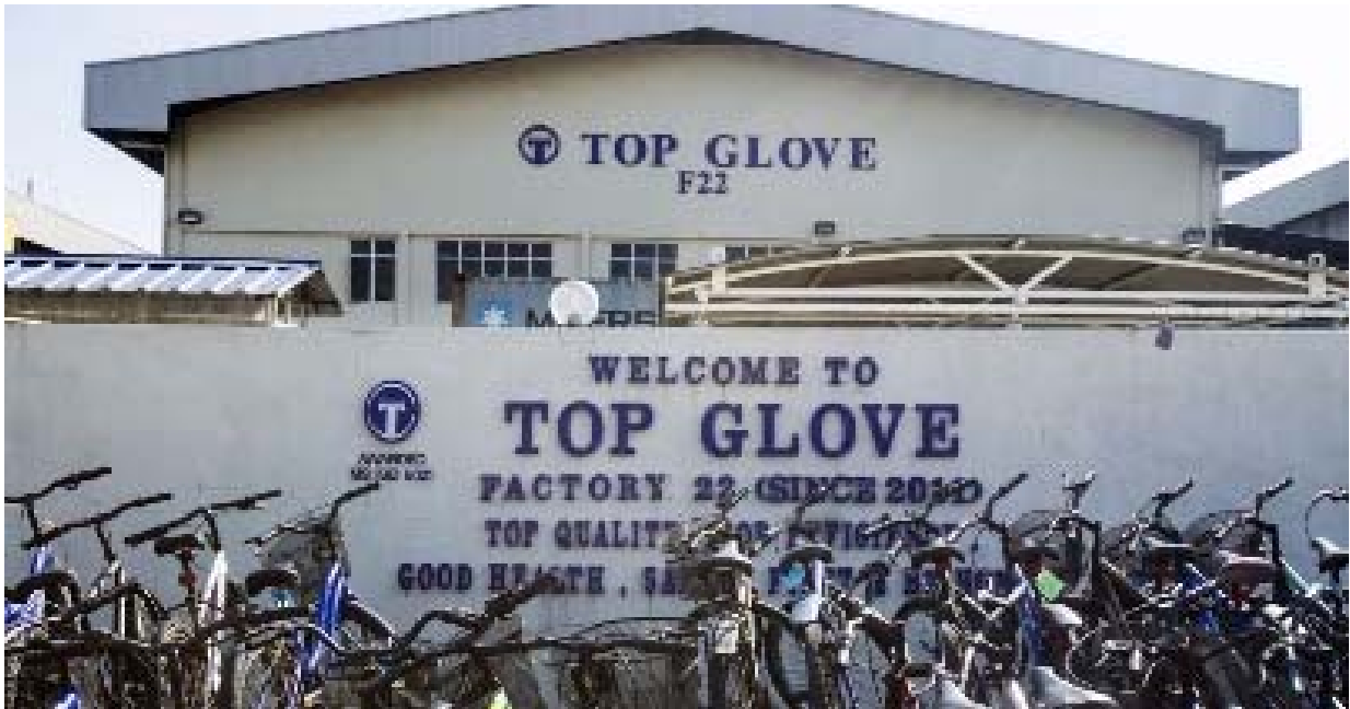
Kilang Top Glove, Meru. - Gambar hiasan

KLANG: Kluster Teratai dikenal pasti sebagai penyumbang kes harian Covid-19 paling tinggi di Malaysia adalah kerana kegagalan pekerja warga asing mematuhi Prosedur Operasi Standard (SOP) dan pihak pengurusan kilang Top Glove yang lambat bertindak.