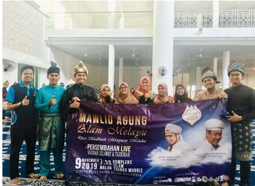
Kemeriahan Sambutan Maulidur Rasul sebelum PKP.

Bagi mereka yang selalu mengimarahkan dan memakmurkan masjid atau surau, mesti di dalam hati mereka perasaan rindu yang teramat sangat untuk melakukan aktiviti-aktiviti kemasyarakatan tersebut.