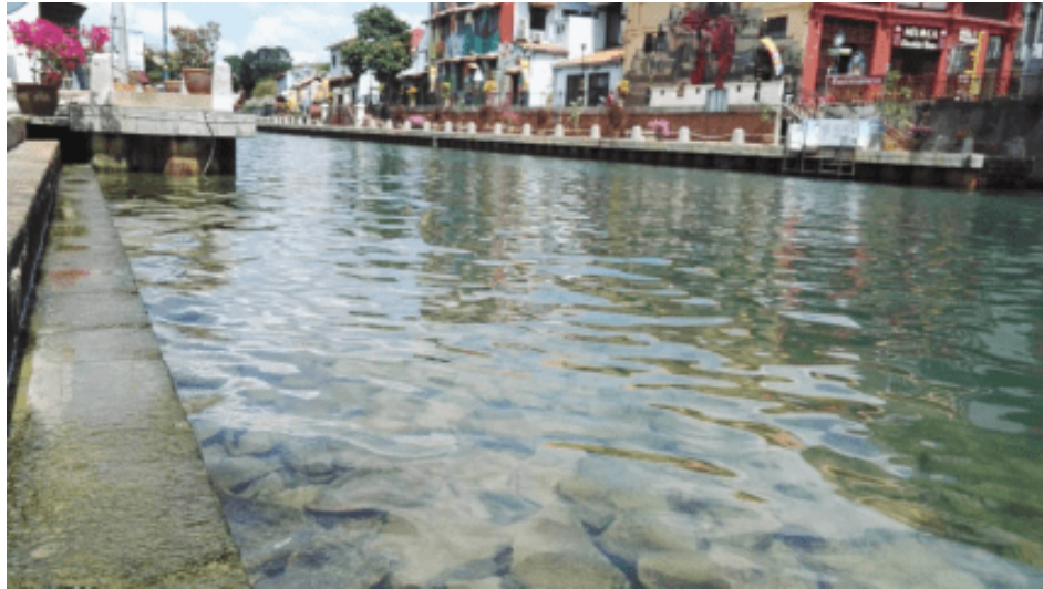
Sungai Melaka, Melaka semakin jernih ketika PKP.

Selain itu, bacaan Indeks Pencemaran Udara (IPU) secara purata berada di tahap sederhana iaitu kurang dari 60, manakala di Kuantan (Pahang), Tanjung Malim (Perak), Paka (Terengganu), Alor Setar (Kedah), Kangar (Perlis) dan Sarawak mencatatkan IPU di bawah 50 iaitu di bawah tahap baik.