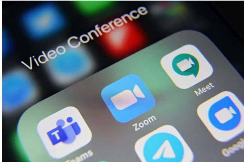
Gambar hiasan: Aplikasi-aplikasi atas talian seperti Duo, Zoom dan Google Meeting semakin mendapat tempat dalam kalangan orang ramai

NILAI: Perintah Kawalan Pergerakan Berperingkat (PKPB) yang dilaksanakan oleh pihak kerajaan sejak beberapa bulan dahulu berikutan pandemic wabak Covid 19 mendatangkan norma baharu kepada pengurusan sendiri dalam kalangan mahasiswa terutama mahasiswa USIM.