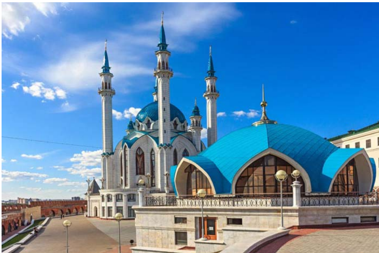
Masjid Kul Sharif di Kazan, Rusia (gambar hiasan)

Keunikan seni bina di negara luar membuka mata kita tentang sesuatu bentuk rumah ibadat yang mempunyai sejarah dan ciri yang tersendiri, malah dapat menarik perhatian orang ramai untuk mengetahui rahsia di sebalik keindahan struktur binaan tersebut.