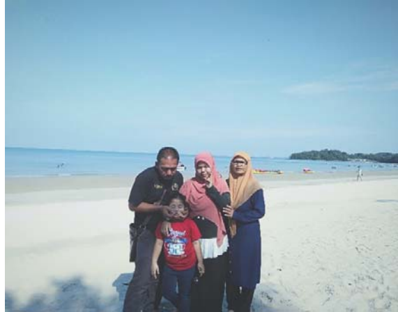
Bersama keluarga di Pantai Teluk Kemang.

Pantai Teluk Kemang telah menjadi pilihan utama semasa percutian kami kerana ia merupakan pantai yang paling besar dan paling popular.