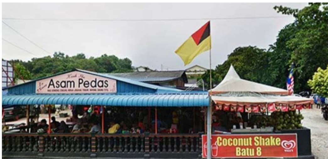
Restoran Asam Pedas Kasih Ibu

Bagi kanak-kanak pula mereka kelihatan leka dengan aktiviti seperti membina istana pasir dan bermain di kawasan lapang berhampiran pantai.