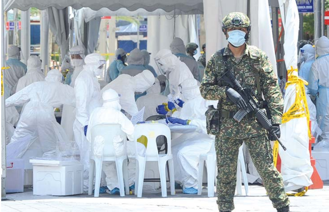
Petugas barisan hadapan sedang menjalankan tugas.

Malah, segenap lapisan masyarakat harus bersama-sama menjalani kehidupan dalam norma baharu dengan lebih berdisiplin.