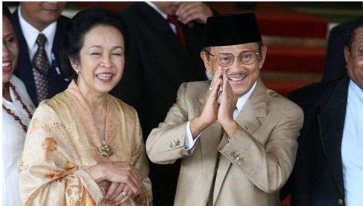
BJ Habibie bersama isteri tercintanya, Ainun dalam satu majlis.

Oleh: Mohammad Akmal bin Mohamad Adli, 1171239, Fakulti Pengajian Bahasa Utama (FPBU), Universiti Sains Islam Malaysia (USIM) Disiarkan pada 23 Ogos 2020