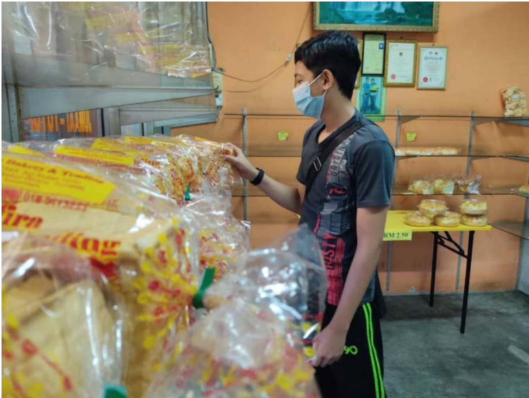
Seorang pelanggan yang sedang memilih roti.

Inisiatif lain turut diambil untuk menaikkan jualan hariannya dengan berniaga secara atas talian termasuk membuat penghantaran rumah ke rumah melalui agen-agen yang dilantik di bawahnya.