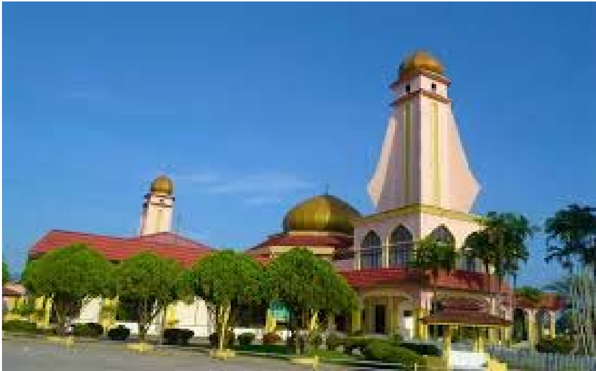
Suasana perkarangan Masjid Sultan Muhammad III

Sementara itu, hanya satu pintu pagar yang akan digunakan sepanjang tempoh arahan PKPB ini iaitu Pintu Pagar Utama berdekatan pondok pengawal keselamatan serta pintu pagar akan dibuka 20 minit sebelum masuknya waktu solat dan akan ditutup setelah mencukupi bilangan 50 orang jemaah yang mendapat jemputan.